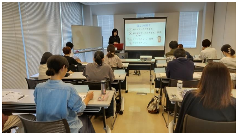
ペアワークでわきあいあい