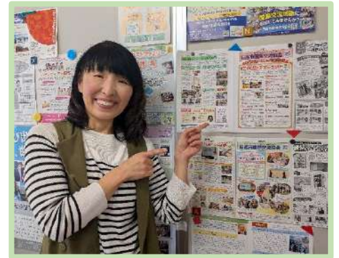
NIA事務室に掲示されたNIAニュースの前で

「えいっ！」とNIA事務室の扉を開けたのがちょうど一年前。英語の教職からの退職後、コロナ禍や親の介護を経て、「とにかく何か始めたい。自分のできることを新しい場所で探したい。何かしら人の役に立ちたい」という思いで飛び込んだNIAの活動は、想像以上にバラエティ豊かで、やりがいを感じるものでした。広報誌づくりやHP更新に翻訳のお手伝い、春から秋までの語学講座のアテンド、異文化交流会への参加にインターナショナルデイの実行委員会の活動…。どれも初めての体験ばかりでしたが、温かく経験豊かな先輩がたのご指導のもと、楽しく学びながら参加することができましたし、その中で人となのご縁も大きく広がりました。新しい挑戦に年齢は関係ない、と教えてくれたNIAには感謝の気持ちで一杯です。今後も日進市の国際交流に関わる活動にできる限り参加しつつ、自分自身の成長を目指していけたらと思います。