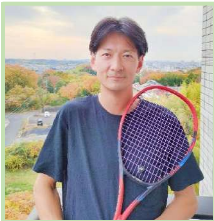
テニススクールに通っています

会社経由のボランティアには複数回参加したことがありましたが、地元への貢献に繋がるボランティアがしたいと思い、色々探していたところ、NIAを発見し入会させていただきました。日進市に住んで約10年が経ちますが、まだまだ日進市のことでも知らないことがたくさんあるなということを痛感しています。NIAの活動では日本語や日進市のことを海外の方に教えることで地域貢献するとともに、日本や大好きな日進市のことを更に知り、知ったことを日常生活の中でもしっかりと味わいながら生活したいと思っています。私自身、英語の勉強やコミュニケーションは好きな方なので、NIAの活動でもその特長を活かし、学習者さんと一緒に楽しく学びながら新たな価値観も得られたらと考えています。趣味はジョギングとテニスなので、もしご興味のある方は一緒にできればと思います。活動参加は新年度からになります。皆様どうぞよろしくお願いいたします。