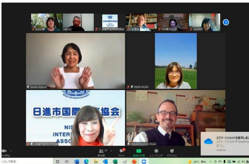
ゲストの方々の集合写真

日進市と外国とをつなぐ国際交流イベントインターナショナルデイ 2021 が、11月20日、日進市国際交流協会主催で開催されました。今年は外国と日進とを結ぶオンライン交流会を開催し、タイ（バンコク）、アメリカ（インディアナ州）、日進市在住の外国人（アメリカ シカゴ出身）の「行ってみて！来てみて！わかった！！体験談」と参加者同士の交流会を楽しみました。