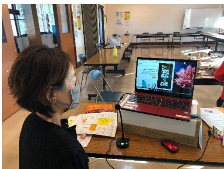
にぎわい交流館での配信の様子