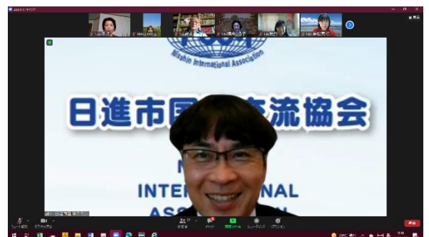
日進市長のご挨拶