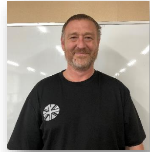
ユーモアたっぷりの クリス先生