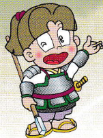
資料館キャラクター “きんずけん”