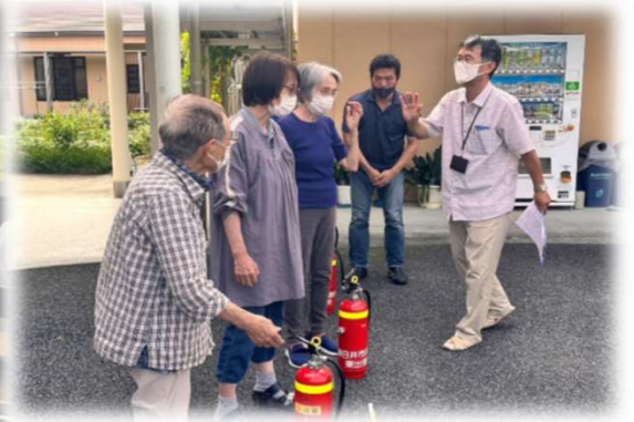
秋の避難訓練を行いました。今回は利用者様にも参加して頂き、希望者は消火器訓練も一緒に行いました。