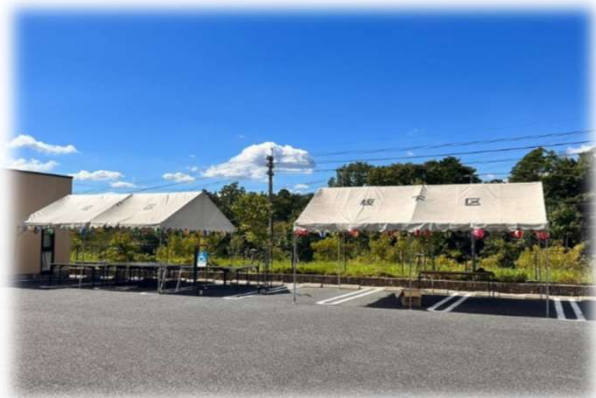
お祭り当日、テントの設営中… この時はまだとっても良い天気です

今年は4年振りの開催でしたが、ご利用者様をはじめ、ご家族様、近隣の方々等沢山の方に参加して頂きました。開始早々から雲行きが怪しくなり、途中雷雨に見舞われるというアクシデントもありましたが、参加者の皆様の協力もあり、無事に終える事が出来ました。皆様の笑顔溢れるお祭りになりました。