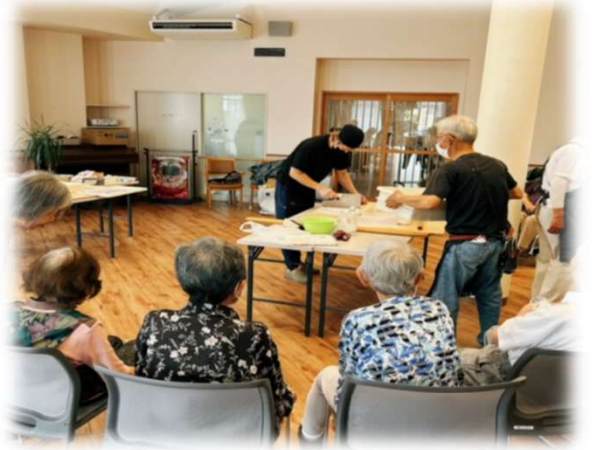
おそばのお供に 稲荷寿司 皆さん流石の 手捌きです