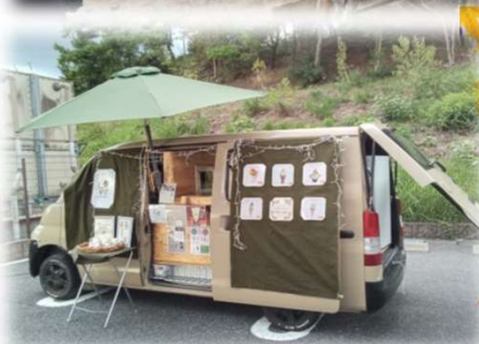
キッチンカーも来てくれました