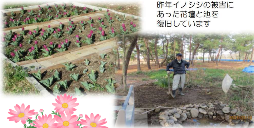
昨年イノシシの被害にあった花壇と池を復旧しています