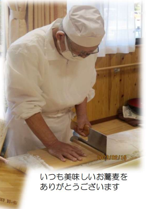
いつも美味しいお蕎麦をありがとうございます