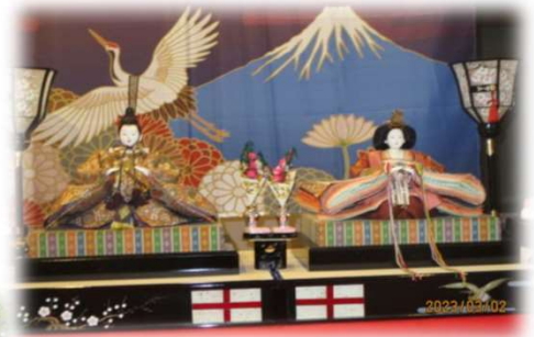
お雛様…今年は背景が豪華です