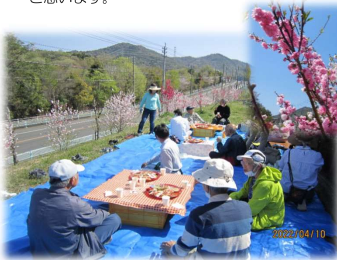
4月10日に行われた観桃茶話会の様子

花が美しく咲いてくれるのは、お世話のご褒美。見て下さる方にもご褒美のおすそ分けをしたいです。