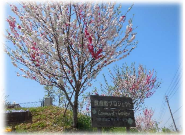
5年前、最初に植えた木

正門を入れて右手の「あきよ花壇」は当会の造作ですが年季が入ってきて修繕が欠かせません。でも6月10日にヒマワリの種を蒔いたので、梅雨が明ける頃にはまぶしい金色の花が見ごろになると思います。